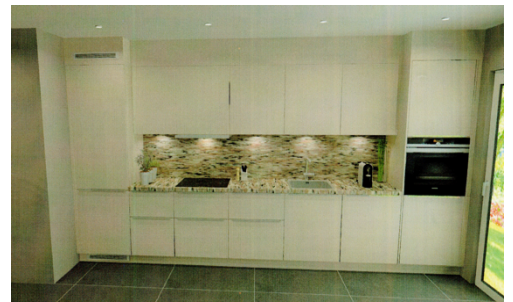
Kitchen - rendering

Monde Avenir S.à r.l., Bureau : 111b, route d'Arlon, L-8311 Capellen Siège Social : 4, rue Aloyse Simon, L-8320 Capellen Tél : + 352 621 355 207 – www.mondeavenir.lu contact@mondeavenir.lu Société à responsabilité limitée au capital de € 12500 BCEE : LU02 0019 4055 9624 7000 Autorisation d'établissement : 10035791/4/5 – R.c.s. Lux. : B 177722 Matricule : 20132422207 – TVA : LU26172666